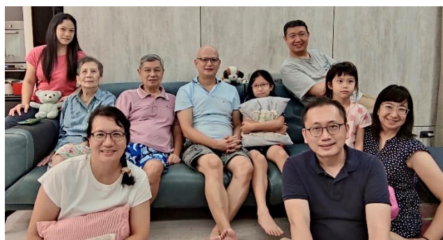
作者(中)全家福合影

「你心裡有得救把握麼？」盼望我們過聖潔的生活，直到闔上眼的那一刻，都能用得勝的態度回答：「上帝兒子耶穌基督的寶血，已經洗去我一切的罪了。」