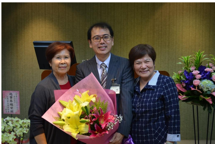
作者(中)與家人合影

感謝神！「天國好生活」是目前我們正在進行的靈命操練的書籍，而這樣與神同行的生活，不是等我們將來回到天家才開始展開，乃是現在我們就要在地上、在每天的生活中就開始來練習如何活出神所喜悅的行為，並用耶穌的觀點來渡過我們的每一天。我們有些人可能才剛信主，有些人可能信主很久了，但都有一些錯誤的觀念需要再次透過教導被校正、調整，或再被建造，進而可以更新我們原本錯植的立場及態度，這樣才能真實的在主的愛中得享安息及釋放！親愛的夥伴們！在主裡的恩典，真的是不可勝數；在主裡的自由，真的是輕省恬適；在主裡的平安，真的是安靜穩當。若你還沒嘗到這樣的主恩滋味，歡迎你來加入主日早上的靈命成長班，相信你將不虛此行，收穫滿滿。