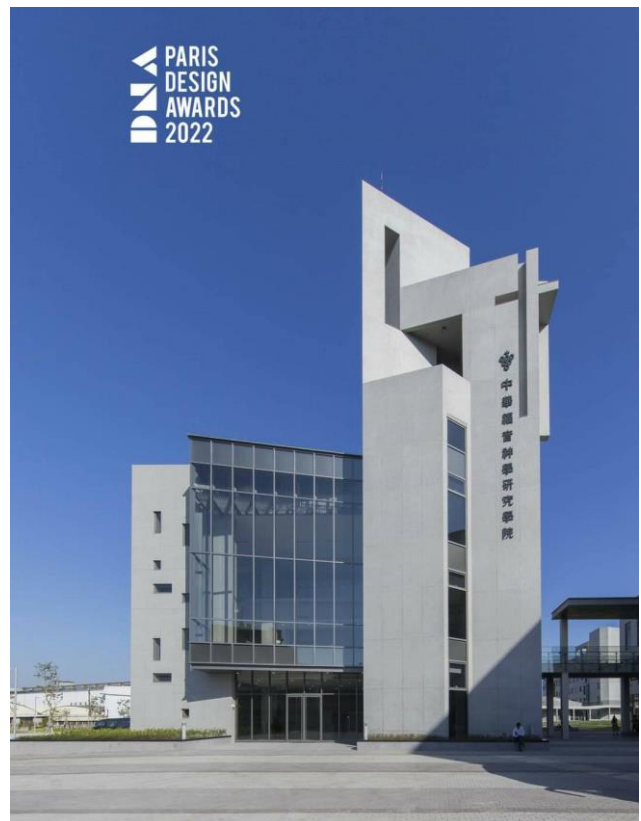
中華福音神學院八德校區