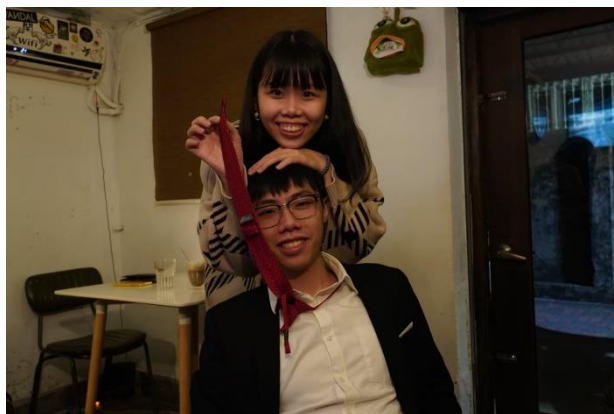
作者(下)與未婚妻合影

肉麵工作一年半；本想再做久一點，但在父母的鼓勵及與牧師推薦下於 2019 年報考華神，並在就學前兩年期間於母會實習，未來的計畫也已與教會有達成共識；因我算是教會派出受訓，所以教會要求將來畢業後直接回母會擔任全職傳道，主要服事年輕人。