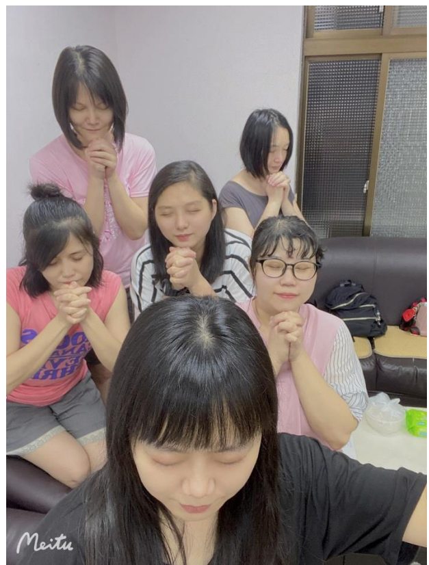
作者(中)與姐妹之家老師、姐妹合影

今一直幫助著我，我也感謝神的憐憫，讓我考上事工科，讓我可以來到門訓受裝備，改變自己的生命來回應上帝對我的愛。雖然我來到門訓之後，對門訓的課業與教會的實習，我也非常的害怕！因為我過去從來沒有接觸過，但是我知道我自己不能離開神，所以我更加要抓住上帝的手。希望我這一年在雙和禮拜堂，可以跟弟兄姐妹們有好的配搭、有好的服事，在基督裏我可以為上帝做美好的見證。感謝神，將一切榮耀歸給神。