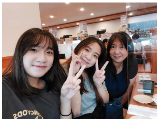
作者(右)與女兒合影

你要保守你心，勝過保守一切，因為一生的果效，是由心發出(箴 04:23)，想要擁有零挫敗人生，心靈成長真是刻不容緩的不二法門。