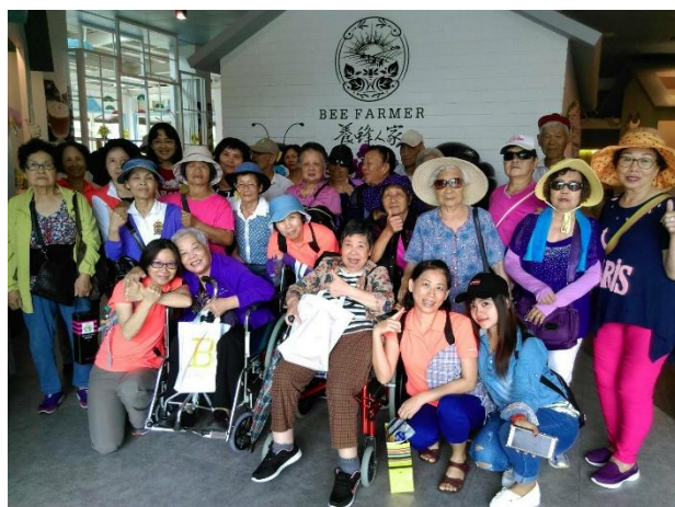
作者於教會全職服事時，與一群可愛的長輩合影

個破碎的家，上帝一個一個的帶回自己的身邊，現在，每年的圍爐夜，不再是各據一方獨自惆悵，而是一家人圍坐在飯桌，開心的談天說笑。