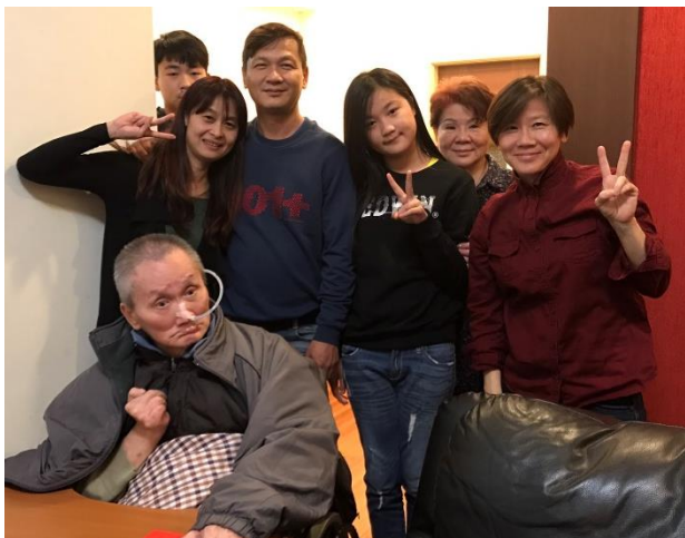
作者父親 2018 年去世前，全家新年團聚留影

無給職的事奉，過程中上帝給我最大的祝福是「全家信主」，上帝果然是信實的神，的確，從一人到一家的祝福，不光是當初對信仰最反對的父親、流浪在外的母親、叛逆的弟弟、甚至是不識字的外婆也在 87 歲高齡受洗，這