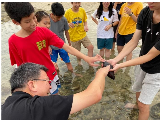
作者(左下)與福音隊同工、澎湖學生合照

那天營會結束後，和隊友一起到「潮間帶」踏水尋寶。發現一隻全身烏黑的海參。大夥兒都很有興趣的觸摸牠一下，然後放到海裡。茫茫大海中各種生物中，一隻海參引起我們的興趣。茫茫人海中，一群烏嶼的朋友是主帶領我們去服事他們的。營會結束後，我們更需要在教會生活中受教導，有興趣常常注視耶穌基督。祂從天外的天為人類而來，將蒙揀選的你我捧在手心上。祂對屬神的人，在患難中不會離棄，不會不顧。在歷史只有這一位神，僅有一位。