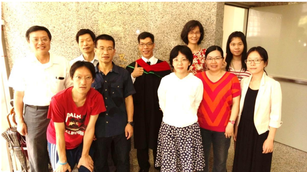
❶ 作者(後中)基隆門訓畢業典禮與環西福音中心弟兄姐妹合影