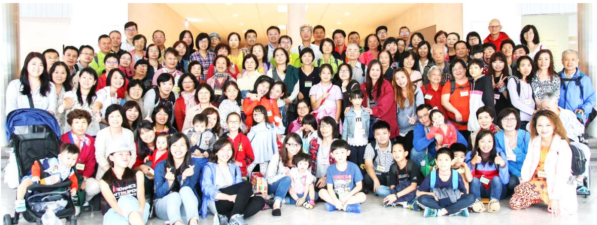
① 2016 年全教會郊遊／朱銘美術館

禱告、祈求，和感謝，將你們所要的告訴神。神所賜出人意外的平安，必在基督耶穌裡，保守你們的心懷意念。」(腓4:6-7)感謝主！