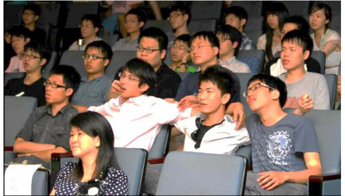
作者(前一)與交通大學電機學院畢業生合影

祂要永永遠遠與人同住。跟大家分享這美好的應許，願我們都成為神所喜悅的人，有神的同在，在我們的一生之中緊緊跟隨主，與主同行。