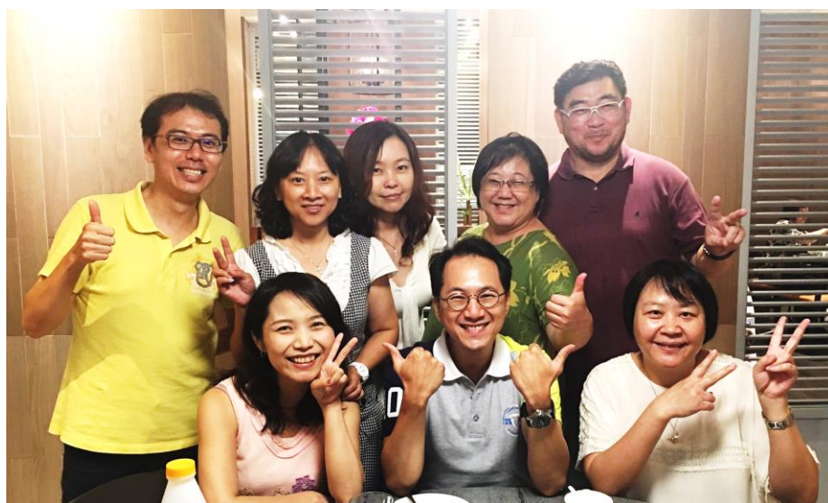
➡ 作者(後右二)與大喜樂小組合影