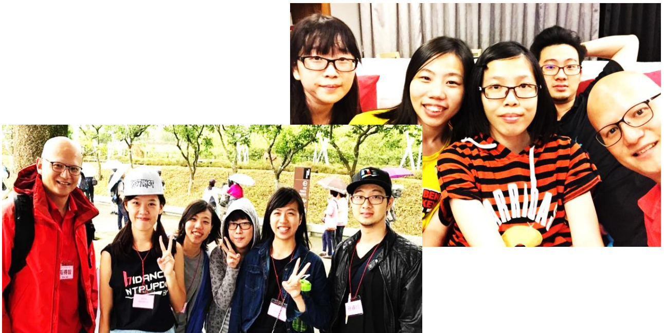
① 學生團契大專組合影

卉是草的總稱、各種各樣的；恩是恩典。卉恩加在一起就是各種來自上帝的恩典。「上帝能將各樣的恩惠，多多的加給你們，使你們凡事常常充足，能多行各樣善事。」(林後9:8) ※卉：字型上有三個十字架，領受各種來自上帝豐富的恩典，應當要回應神的愛，跟隨耶穌，揹起自己的十字架。