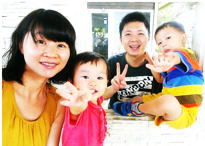
📍 作者(右二)與太太、兒子、女兒合影

最後附帶一提，當我們替有著同樣遭遇的夫妻禱告時，我們真實的經歷也成為了別人的祝福。