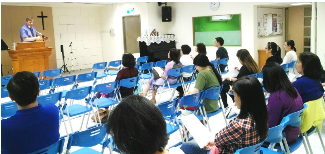
① 按聖經教養兒女講座

老師，自己有七個孩子，又有三位外孫，對於使用聖經原則教養兒女相當有經驗，遂邀請牧師抽空到環西舉辦「如何按聖經教養兒女」講座，葉牧師以相當多的自身教養實務來舉例，從幼兒到青少年，甚至同性戀發展的議題都有提到，讓我們受益良多。從家庭倫理秩序的建立，落實在家庭長輩、晚輩的相處關係中，也以耶穌基督的榜樣、三一神的彼此尊榮、彼此相愛關係做引伸。更以父母如何在君王、祭司、先知的三個角色中做到保衛兒女，為兒女代求，提醒、勸誡兒女的責任，使父母們瞭解到自己必須先效法基督，才能落實以聖經原則教養兒女。